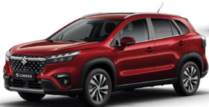
Rojo Energético Perlado