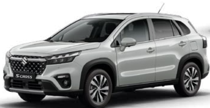
Plata Seda Metalizado