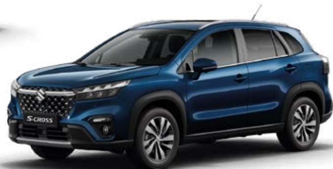
Azul Esfera Perlado