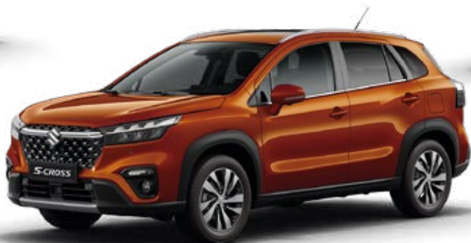
Marrón Canyon Perlado Metalizado