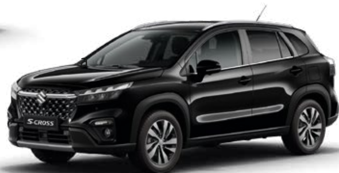
Negro Cósmico Perlado Metalizado