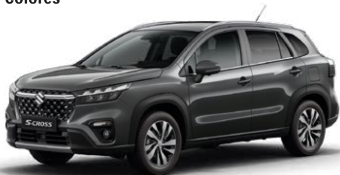
Gris Oscuro Titán Perlado Metalizado